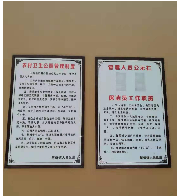
建立《新街镇农村卫生公厕管理制度》